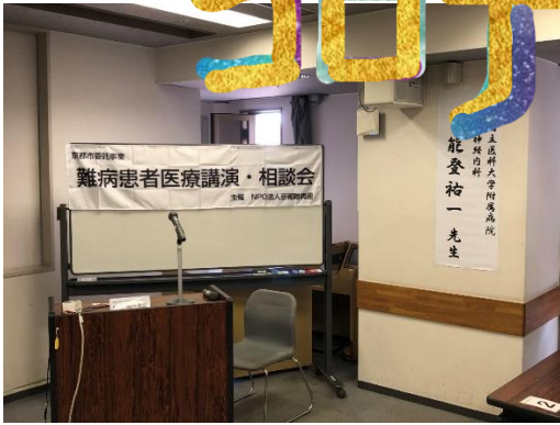
開始前：能登先生登場待ち