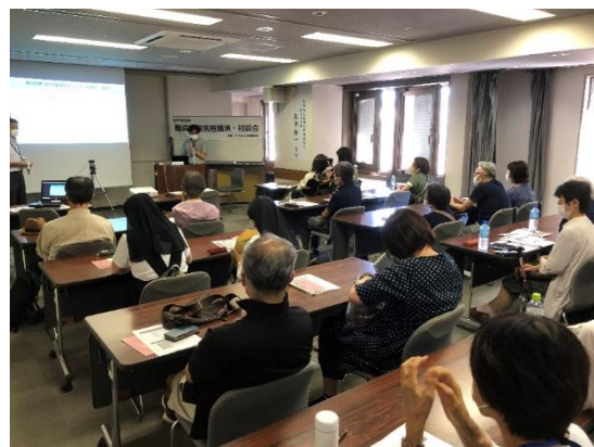
この時期、やっぱりコロナ関係の質問が