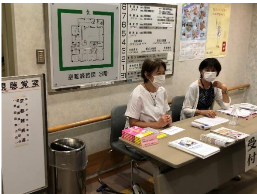
受付エレベーターを降りると目の前が受付