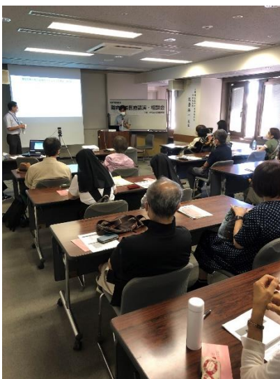
講演が終了し、質問・相談が多く寄せられた