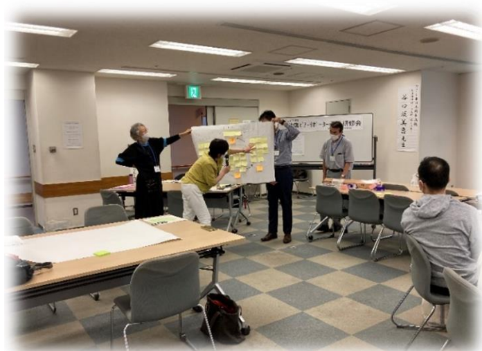
各グループ_発表中