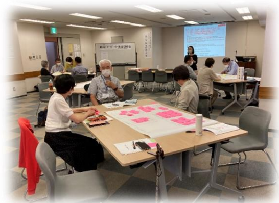
グループセッション中